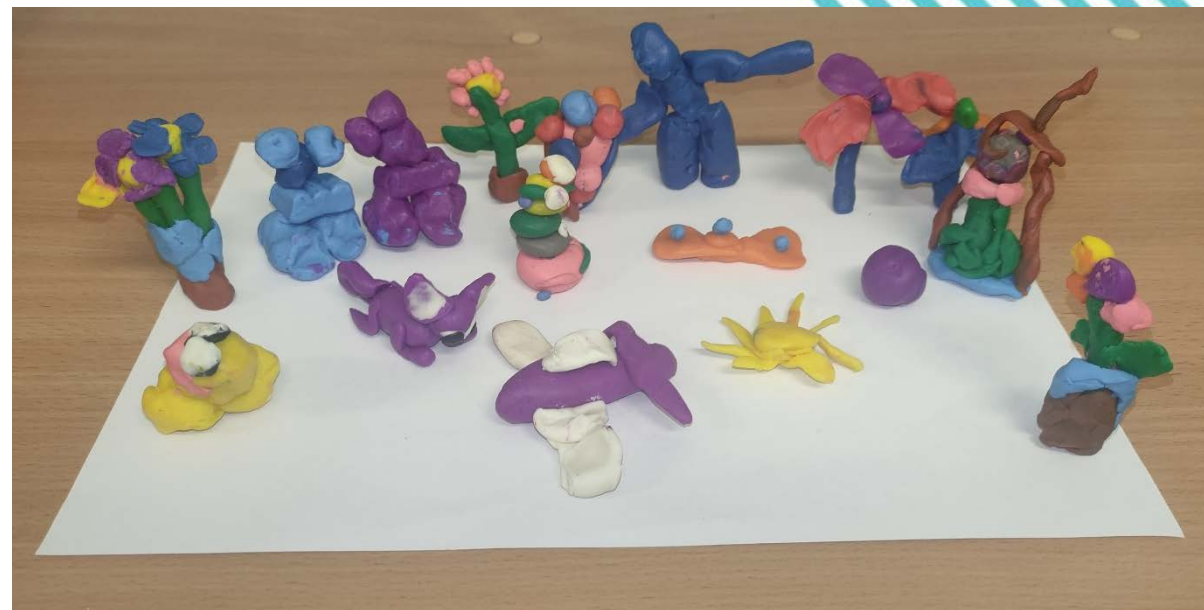
Лепка «Подарок другу»